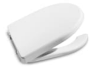
Tapa y asiento con aro abierto y apertura frontal para inodoro