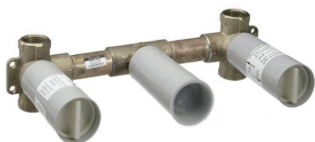
Ilustración del producto